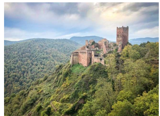
Le château de Saint Ulrich

N 48.198846° / E 7.315597° - alt. 283 m - km 7,14